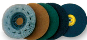
Ampia scelta di spazzole e pad