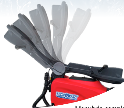
Manubrio completamente reclinabile salvaz spazio