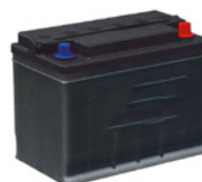
Batteria al Gel